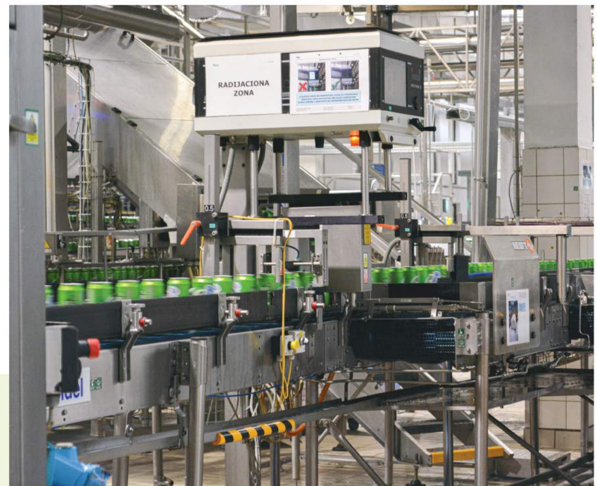
Održivi procesi na liniji za punjenje limenki