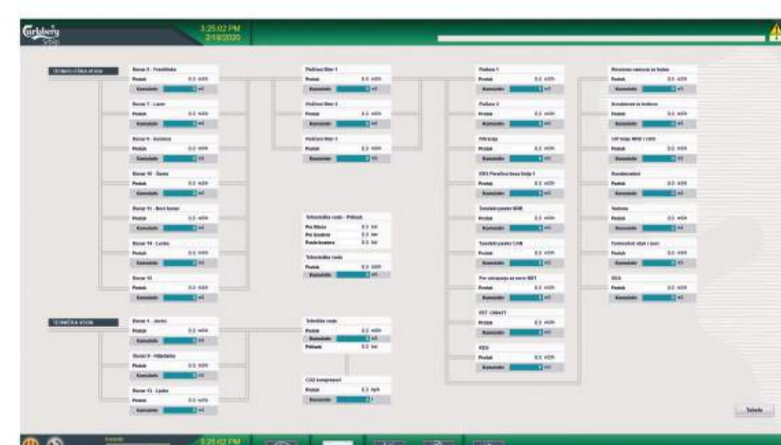
Pregled potrošnje vode/pare/gasa na preko 100 mernih mesta

Po implementaciji energetskog menadžmenta (EMS), daljom analizom procesa, kompanija Carlsberg Srbija je izrazila želju da se sistem nadzora i upravljanja proširi. Prirodni korak je bilo uključivanje sistema za hemijsku pripremu vode. Kontrola i monitoring procesa u HPV je prethodno vršena na tri različita mesta, na pumpnoj stanici, karbon filterima i reverznoj osmozi. Implementacijom EMS sistema baziranog na zenon softveru, sve ovo je integrisano u jedinstven projekat sa tri kontrolera. Sistem, pored centralizovanog nadzora, omogućava i upravljanje čitavim postrojenjem. Kapacitet proizvodnje vode je 165 m 3 /h, dok operater ima mogućnost uvida u kompletno postrojenje u energetskom (utility) centru kroz intuitivni grafički interfejs.