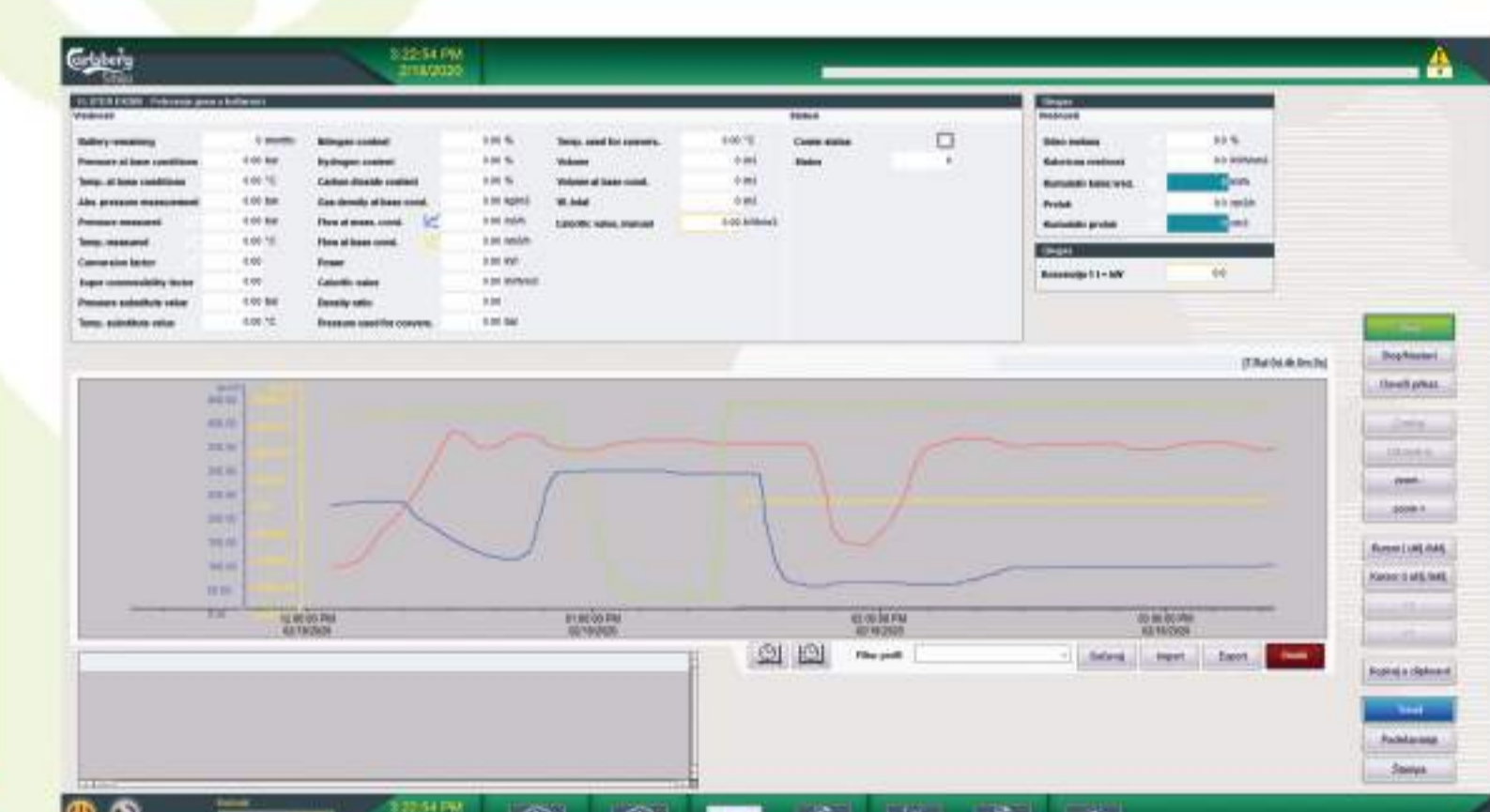
Dijagrami potrošnje se mogu jednostavno filtrirati

"Uvođenjem sistema energetskog menadžmenta, baziranog na zenon Softverskoj Platformi, korak smo bliže implementaciji ISO 50001 i ispunjenju zacrtanih ciljeva nultog uticaja na životnu sredinu"